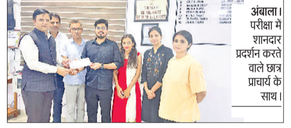
अंबाला। परीक्षा में शानदार प्रदर्शन करते बाले छात्र प्राचार्य के साथ।