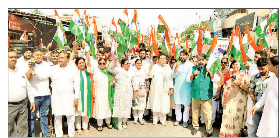
अंबाला। तिरंगा यात्रा के दौरान भाजपा नेता व कार्यकर्ता।

निकाली जा रही है। बीते कल मुख्यमंत्री नायब सिंह सैनी ने पंचकूला से इस यात्रा का शुभारंभ किया था। इस यात्रा के माध्यम से हम भारतीय सेना जिसमें वायुसेना, आर्मी व नेवी है उन्हें हम सैल्यूट करते हैं जिन्होंने पाकिस्तान में घुसकर उन्हें मुहताज जवाब दिया है। उनके छक्के छुड़वाए हैं। हमारी सेना ने 26 लोगों की मौत का बदला कई सौ आतंकियों को मौत के घाट उतारकर लिया है। भारतीय सेना का यह आतंकवाद को मुहताज जवाब है।