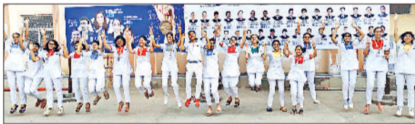
महेंद्रगढ़। खुशी जाहिर करते विद्यार्थी।