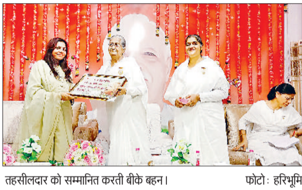
तहसीलदार को सम्मानित करती बीके बहन।

अंबाला। थाना अंबाला सदर में दर्ज चोरी के मामले में पुलिस ने आरोपी लक्की व लविश को गिरफ्तार किया है। पीड़ित महिला ने 28 अप्रैल 2025 को शिकायत दर्ज करवाई थी कि आरोपी ने छोटी घेल अंबाला शहर में स्थित उसके घर का ताला तोड़कर सोना-चांदी जेवरत चोरी किए हैं।