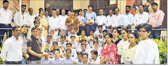
पानीपत। आर्य स्कूल के मेधावी विद्यार्थी व खिलाड़ी अतिथियों के साथ।