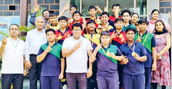
पानीपत। महाराजा अग्रसेन स्कूल की विजेता टीम प्रथम मुद्रा में।