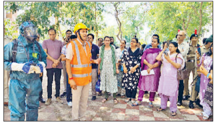
ईंट। शहीद उधम सिंह राजकीय महाविद्यालय में आपदा प्रबंधन की जानकारी देती एसडीआरएफ की टीम।